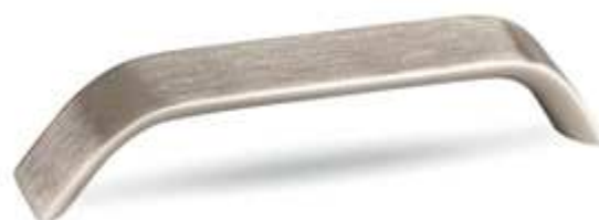
Úchytka rozteč broušená nerez rozteč 192 mm