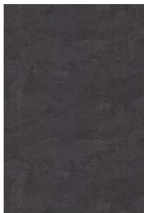
Břidlice Jura antracitová