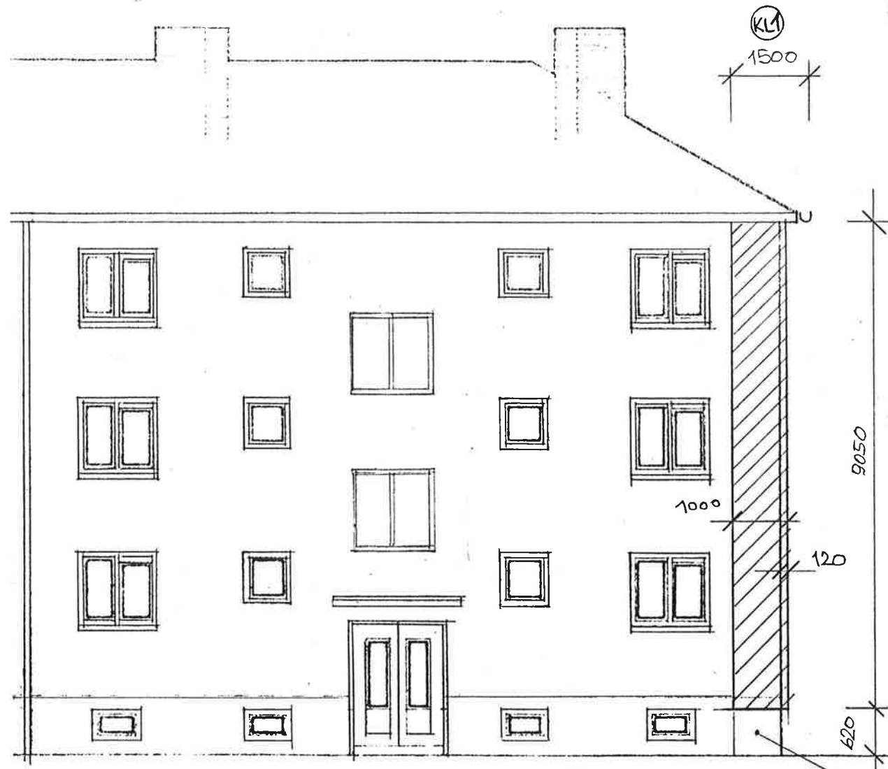
POHLED P4: M. 1:100